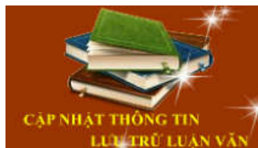
Hình 2: Banner liên kết trang biểu mẫu

Bước 2: Click vào “Cập nhật thông tin lưu trữ luận văn - Online”