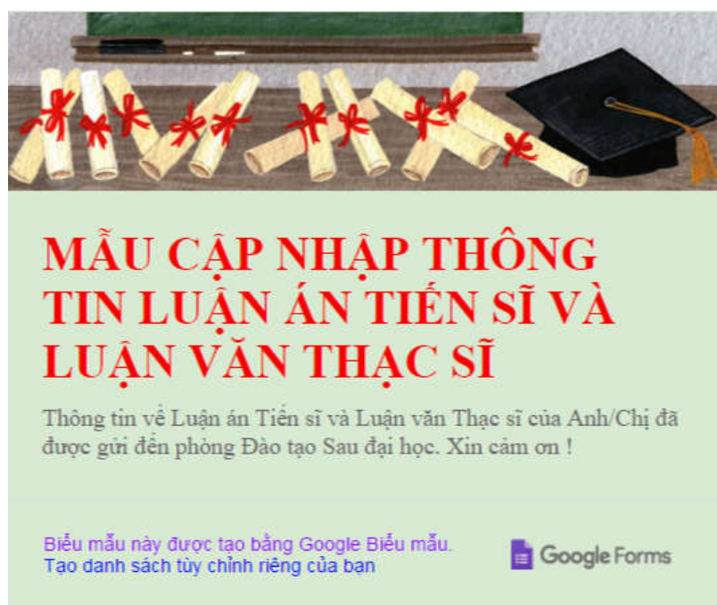
Hình 5: Giao diện sau khi đã cập nhập thành công biểu mẫu

Bước 5: Khi đăng ký thành công hệ thống sẽ trả lời lại.